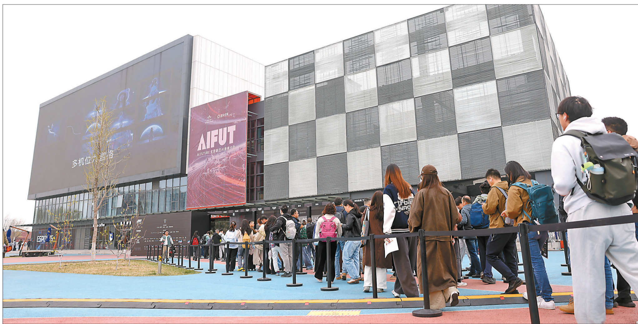
昨日，北京亦庄AI未来大会在北京智慧电竞赛事中心启幕。这场人工智能盛会集高端论坛、沉浸体验、产业对接与大众科普于一体，吸引来自产业界、科技界及社会公众2000余人参与。