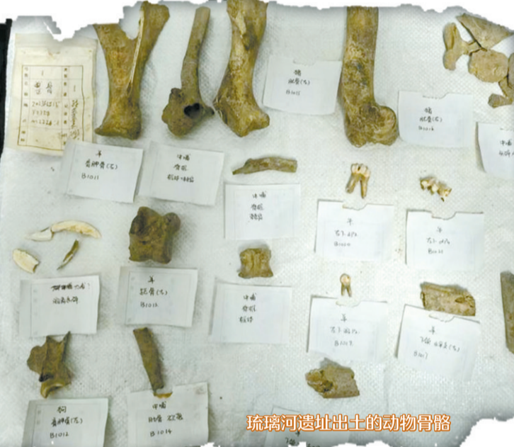
琉璃河遗址出土的动物骨骼