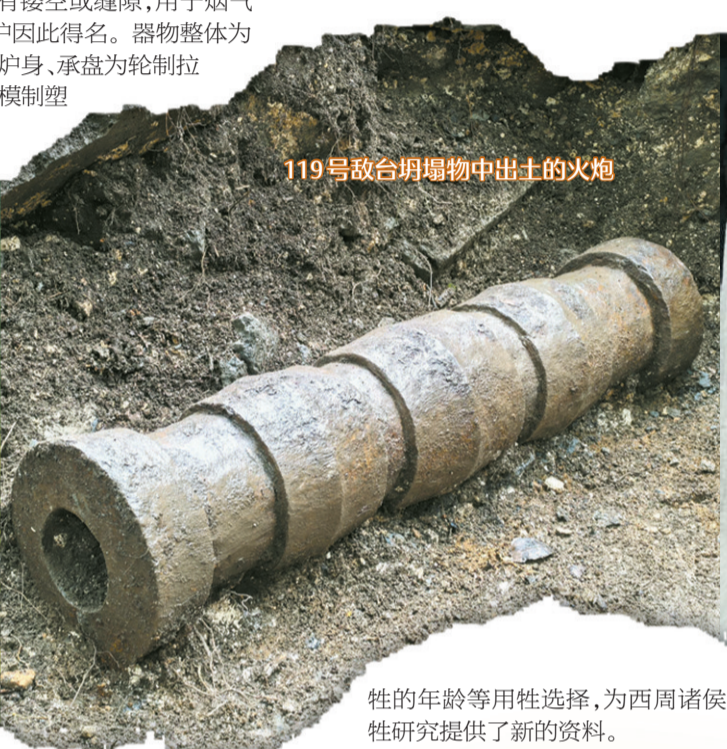
119号敌台坍塌物中出土的火炮