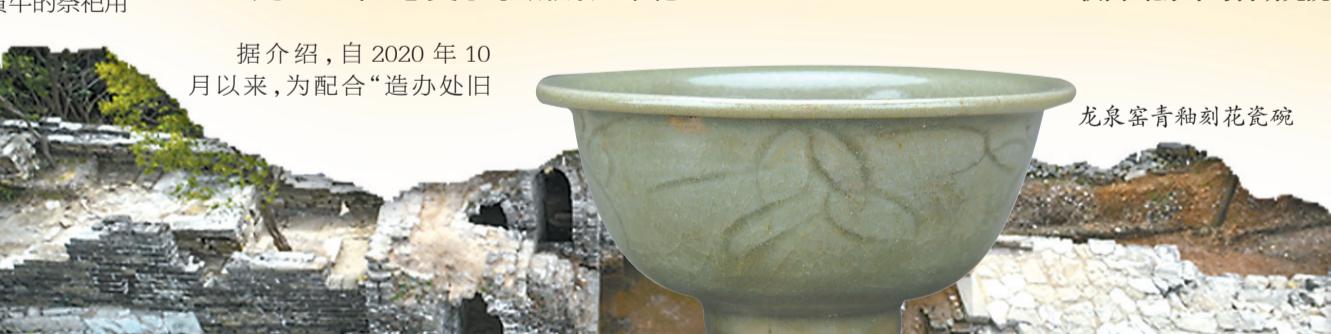
龙泉窑青釉刻花瓷碗