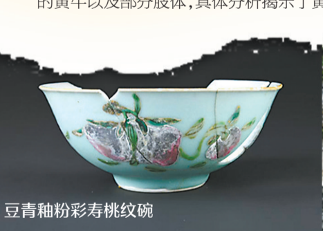
豆青釉彩寿桃纹碗