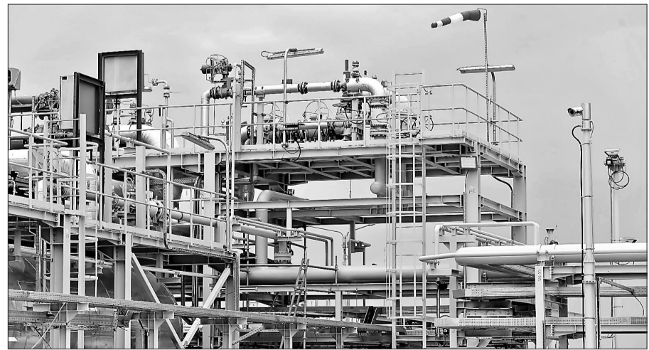
在罗马尼亚康斯坦察县瓦杜村拍摄的天然气处理站