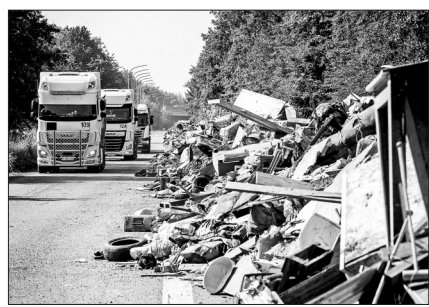
7月20日，比利时佩平斯特，民众清理后的洪水灾区现场

另一家日本汽车制造商丰田公司先前提说8月将削减爱知县高冈工厂产量，缘由是芯片采购有困难。这家主要生产卡罗拉车型的工厂下月将部分停产5天，减产约9000辆汽车。丰田位于岩手县和宫城县两家工厂的生产线6月一度停产，影响2万辆汽车的生产计划。