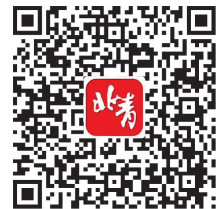
扫码下载北京头条App

沃兹尼亚奇,值得一提的是,中国“金花”张帅、郑赛赛和王蔷都已直接入围正赛。男选手中,男子网坛四巨头之一、大满贯得主穆雷今年将重返中网赛场,此外还包括现世界排名第六的希腊新星西西帕斯、排名第八的俄罗斯名将卡恰诺夫,以及加拿大超级新星阿利亚西姆等。