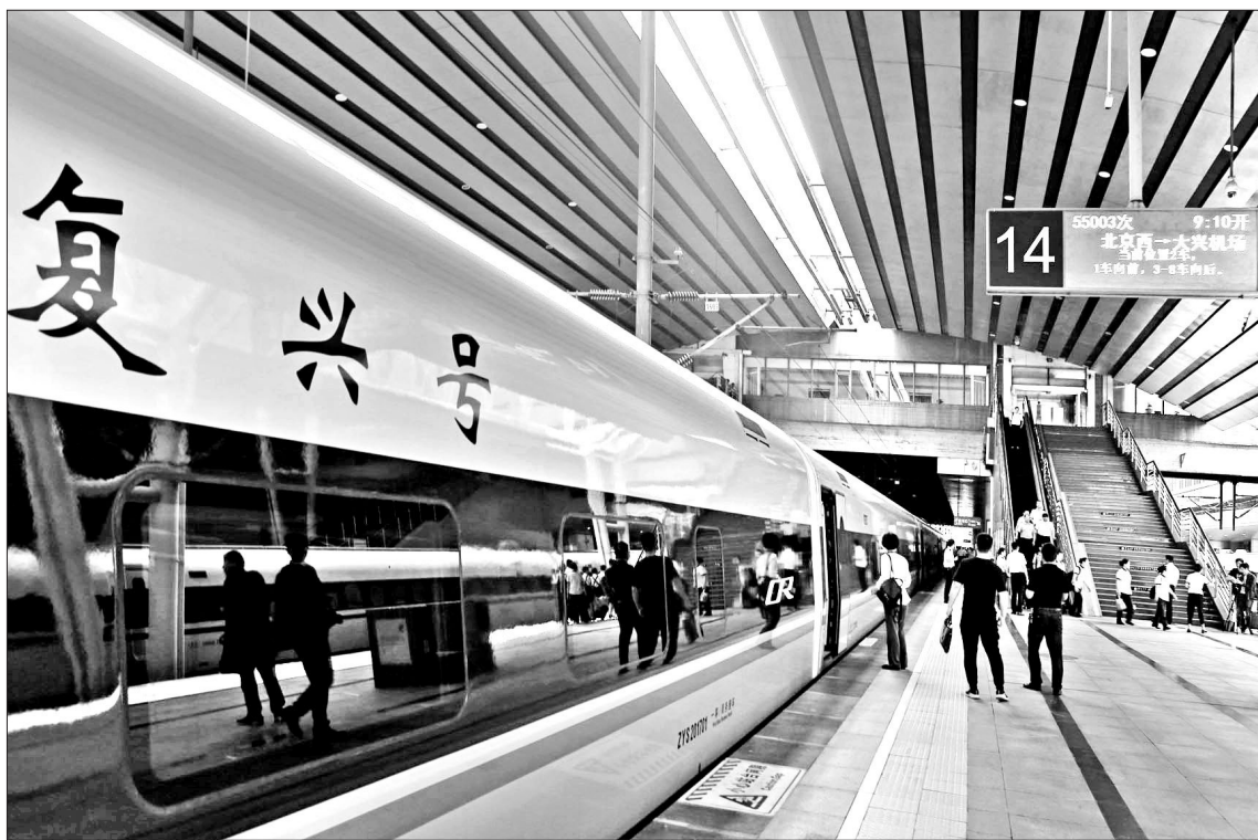
复兴号动车已开始往返北京西站和大兴机场

试验期间,动车组将按照运行图组织行车。同时,结合运行试验对前期测试发现的缺陷进行调整及复测,为完善科学合理的运输组织方案提供技术依据,确保京雄城际铁路(北京段)9月底具备开通运营条件。