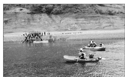
消防队员在事发河段搜救失联者

急,水深约30米,河面宽60余米。该船为非营运的动力驱动铁皮船,是当地农户生产生活自用船。根据现场视频和照片显示,事发前,涉事船上的人员并不在船舱内,而是或站或坐在甲板上,其中一名男子站在甲板拿着撑杆,船只两侧有低矮的铁围栏。事故发生后,船只侧翻在江中。