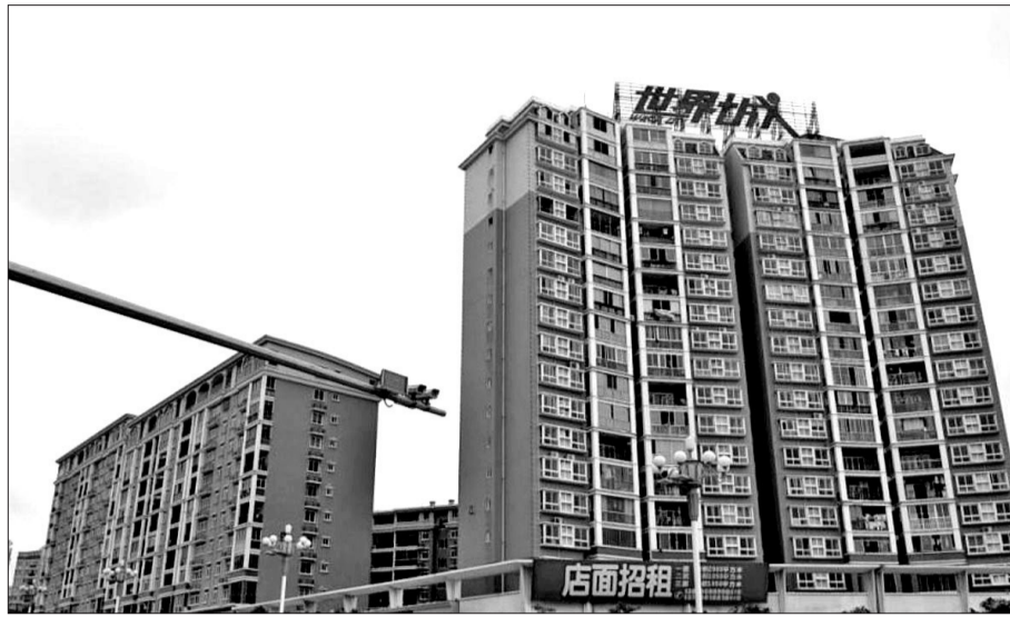
福建平潭涉事小区外景

律师分析称，运营商有权进行基站建设，也有义务向小区业主提供电信服务，除非得到业委会或其他可以代表全体小区业主意愿组织的同意，否则运营商不应拆除基站。同时，基于社会公共利益的需求，小区业主对移动通信基站等公用电信设施行为负有法定的容忍义务。