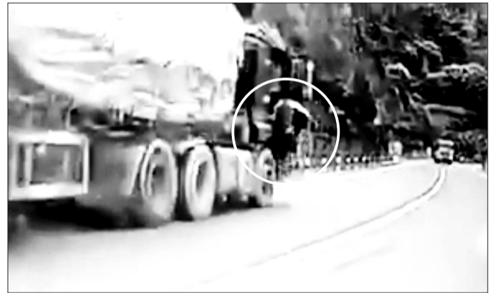
男子“飞身拦车”的一幕