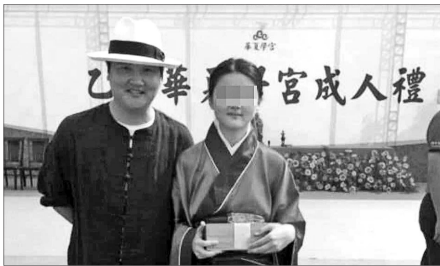
孙楠在华夏学宫参加女儿的成人礼