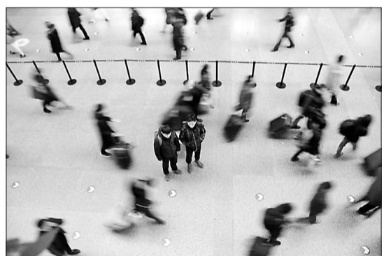
反扒队员藏身在人群中