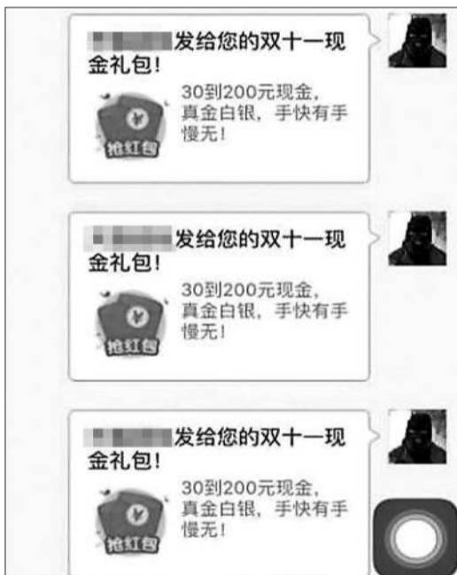
警方曾发布的警示图片

常见的模拟成“微信红包”,还可能冒充“微信语音”。去年,一名网友曾在微博中发布消息称,自己收到了一条语音信息,点开之后,语音信息摇身一