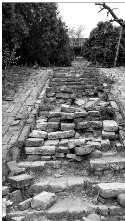
墓内台阶多处破碎

陵墓的碑楼已被铁栏杆围住保护,无法直接进入。不过在碑楼靠西的一侧,北青报记者发现围栏