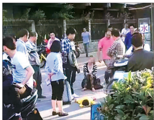
网上流传的视频截图