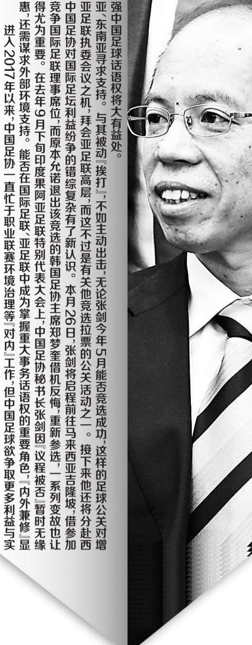
进入2017年以来,中国足协一直忙于职业联赛环境治理等“对内”工作,但中国足球欲获取更多利益与实现

郑梦奎宣布参选后也引起了国内足坛的热议。中国足协一位人士指出,相比于亚足联副主席,国际足联理事在国际足坛重大事务决策方面更具话语权,郑梦奎反悔恐怕也是基于对利益轻重的权衡。中国足协此时此刻指责韩国足协或郑