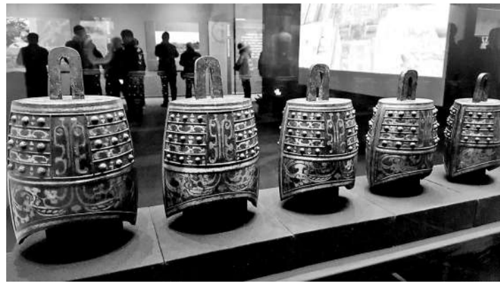
修复过的贴金耳针