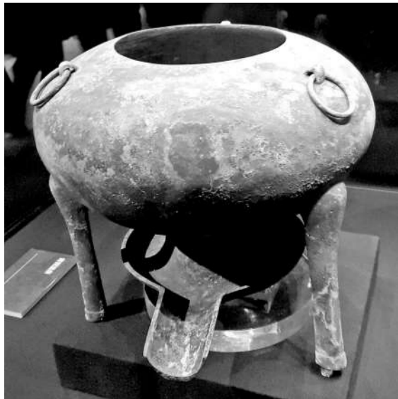
青铜温鼎(汉代火锅)

珠光宝气的金器、玉器，往往引得人们啧啧称赞。其实，在考古学家的眼里，文物上的信息比金银更珍贵。海昏侯墓主身份的确定，靠的就是墓葬内出土的文字类文物。“大刘记印”“海”“昌邑籍田”“刘贺”等文字的陆续发现，使得人们对墓主身份的认识越来越清楚。简牍、木牍等带有文字性的文物一般都很难保存，它们或被偷盗破坏，或遭自然风化，存世的数量很少。在有明确墓主姓名的墓内——刘贺墓中出土了数以万计的竹简等文字类文物，仅仅数量就已经令人震惊了，而经过红外照相处理，考古学家发现，这些文字的内容包括《论语》《易经》《礼记》、方术、与养生和房中术有关的医书、描写冢墓的赋等等，简直就是一个小型的图书馆。它们能够带来一手的、直接的历史信息，是澄清海昏侯刘贺相关历史谜团的重要证据。